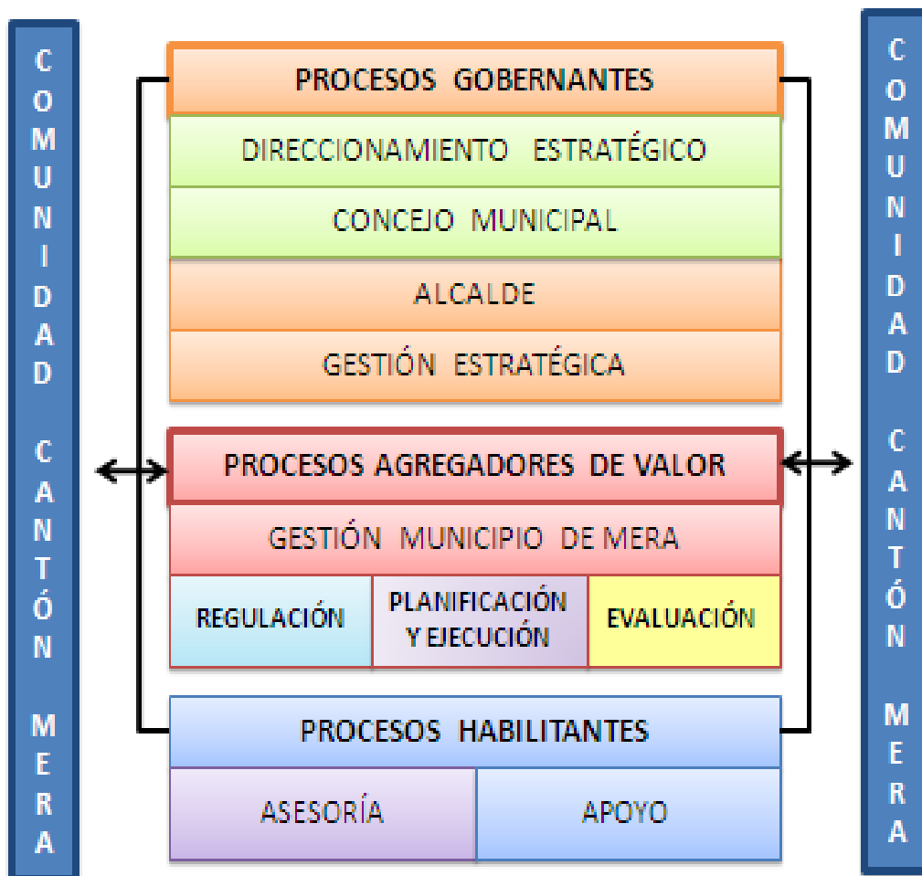
c) Estructura orgánica