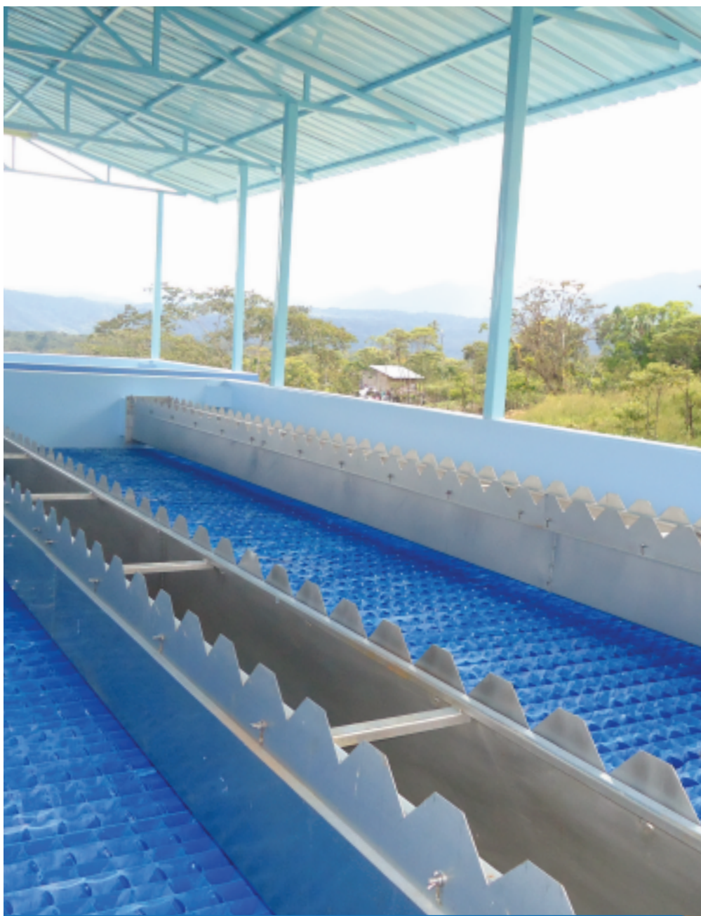
CONTRATO COMPLEMENTARIO CONSTRUCCIÓN Y MEJORAMIENTO DEL SISTEMA DE AGUA POTABLE DE MERA, SHELL Y MADRE TIERRA.