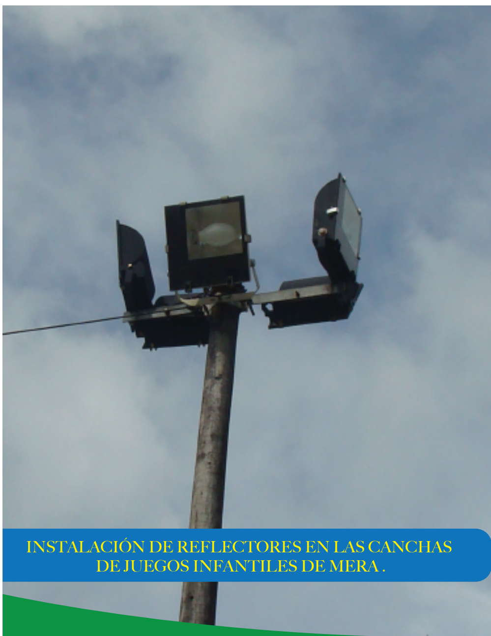
INSTALACIÓN DE REFLECTORES EN LAS CANCHAS DE JUEGOS INFANTILES DE MERA .