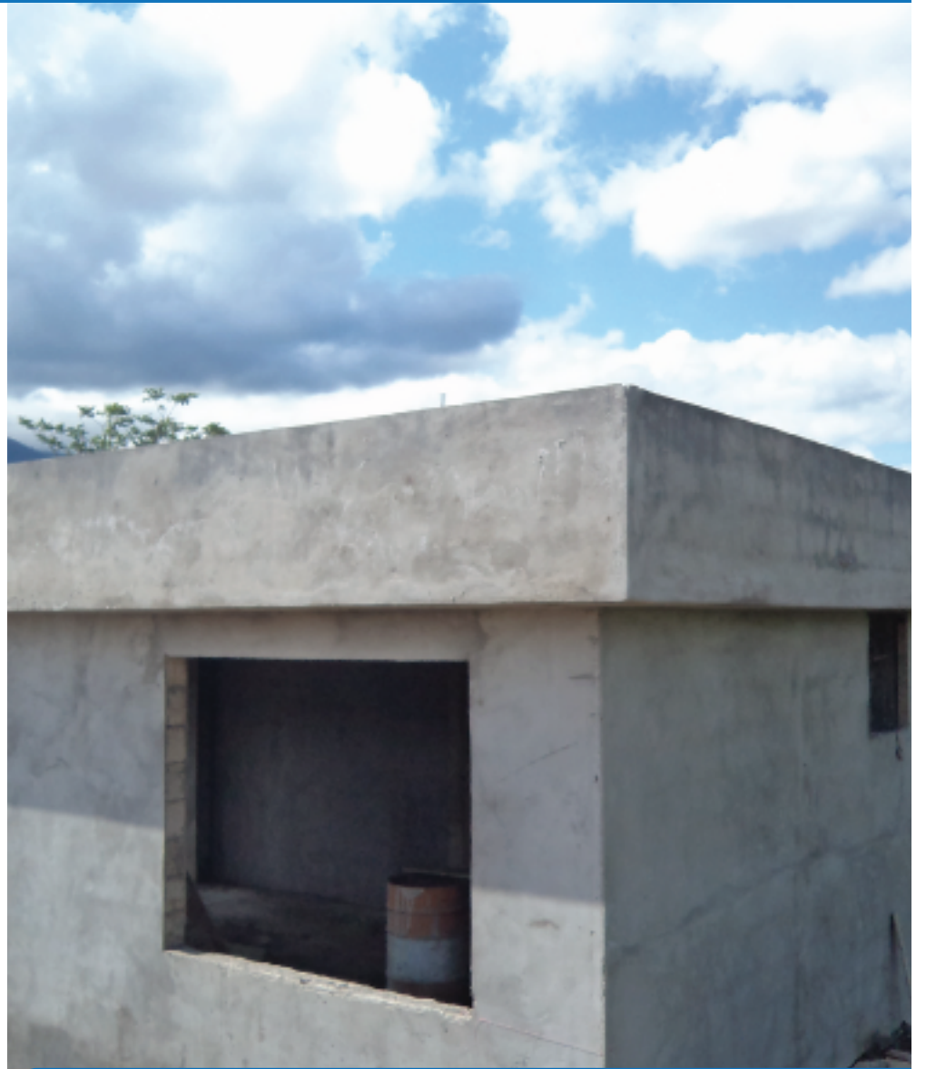
CONSTRUCCIÓN DE SEDE MUNICIPAL CANTÓN MERA.