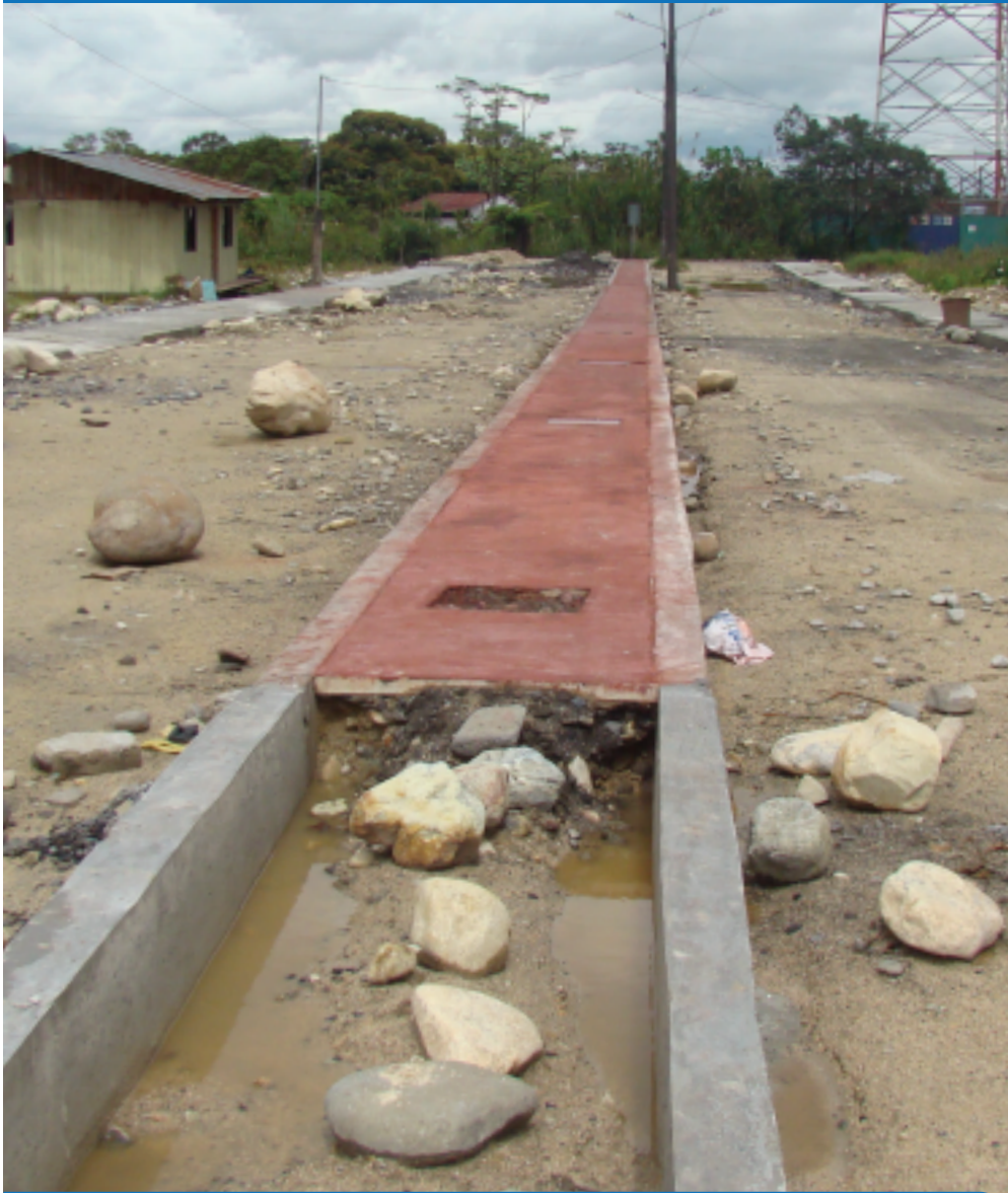
CONSTRUCCIÓN ACERAS BORDILLOS Y PARTERRE CIUDADELA POPULAR