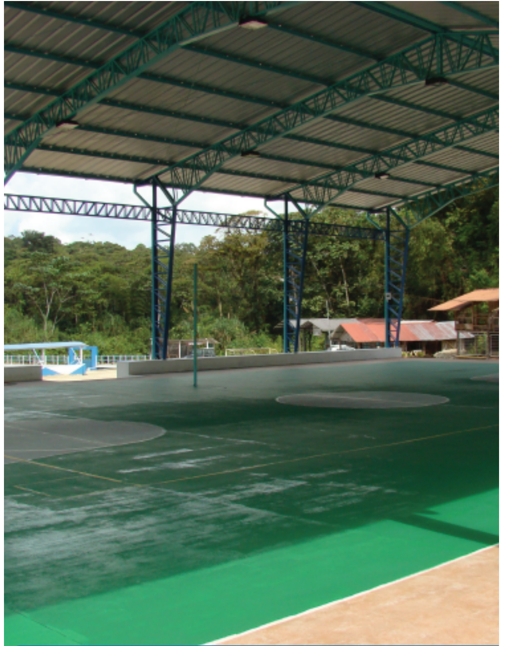
CONSTRUCCIÓN CANCHA CUBIERTA DE USO MÚLTIPLE PARA EL DIQUE DE MERA.