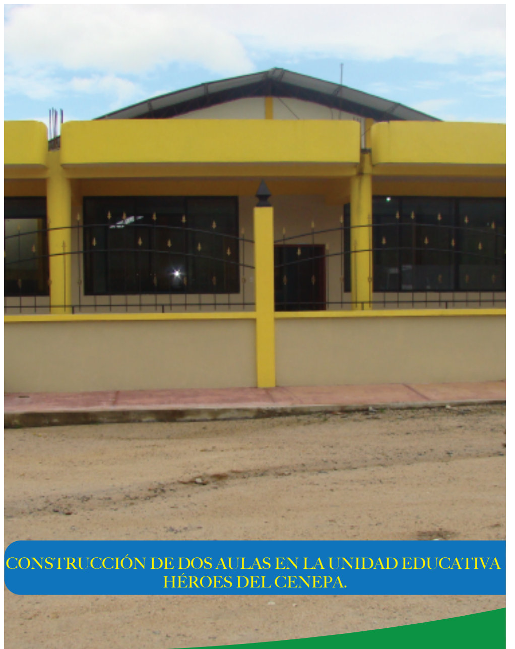
CONSTRUCCIÓN DE DOS AULAS EN LA UNIDAD EDUCATIVA HÉROES DEL CENEA.