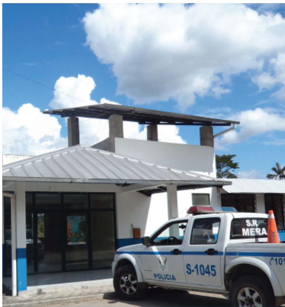
ADECUACIÓN DESTACAMENTO POLICÍA DE MERA .