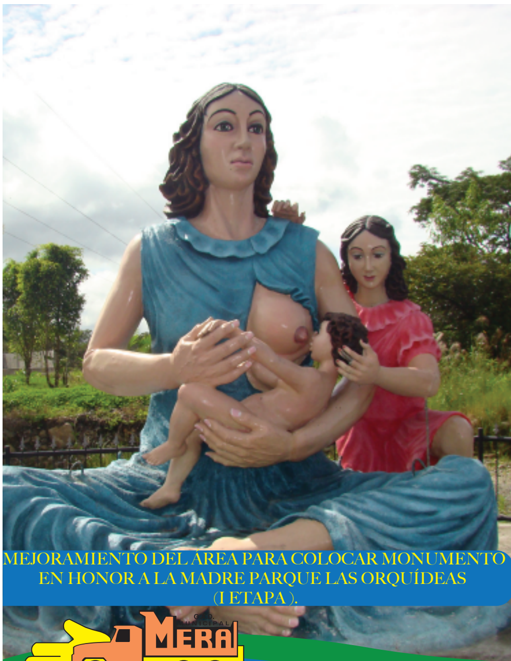
MEJORAMIENTO DEL AREA PARA COLOCAR MONUMENTO EN HONOR A LA MADRE PARQUE LAS ORQUÍDEAS (1 ETAPA).