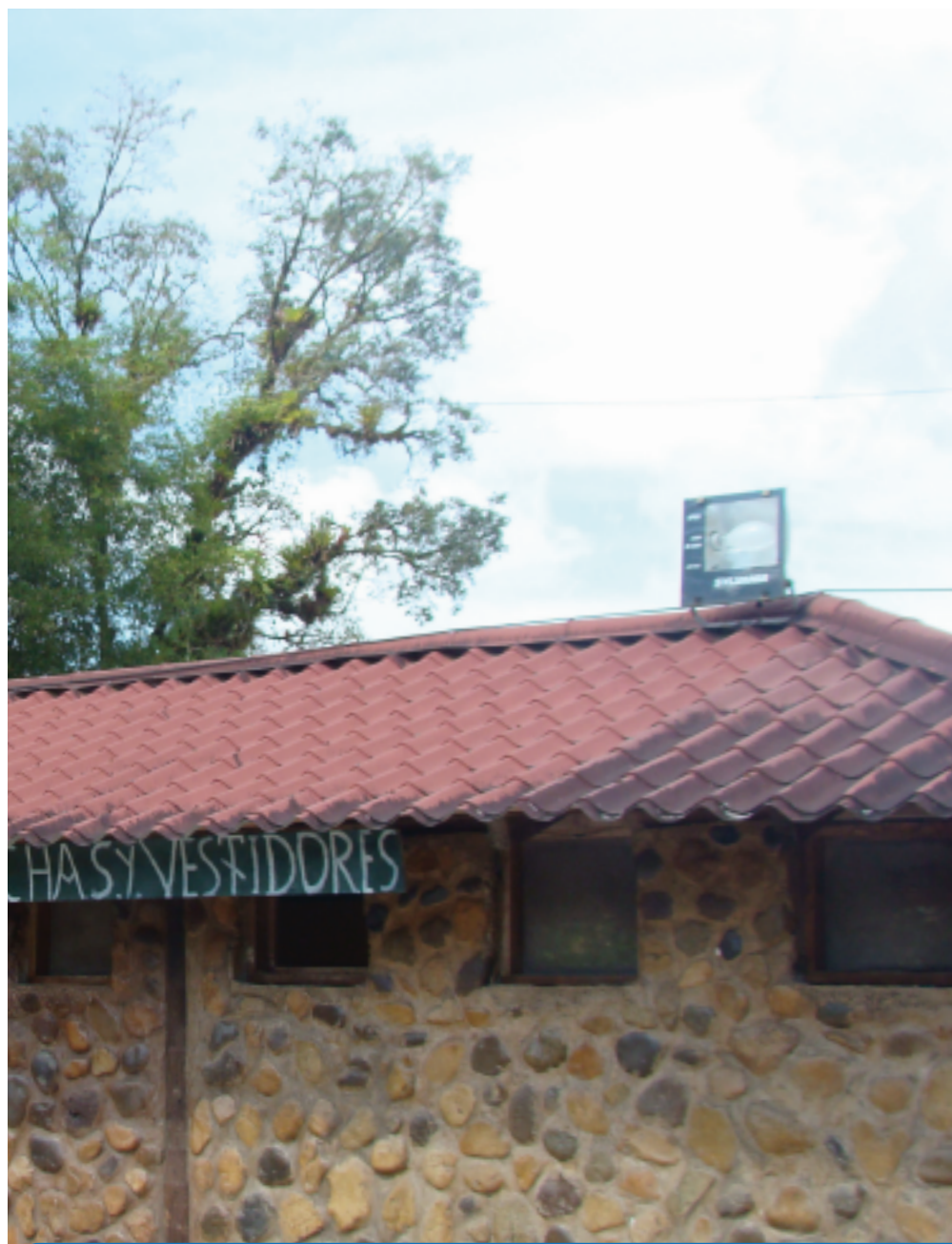
COLOCACIÓN DE LUMINARIAS EN DIQUE QUE MERA.