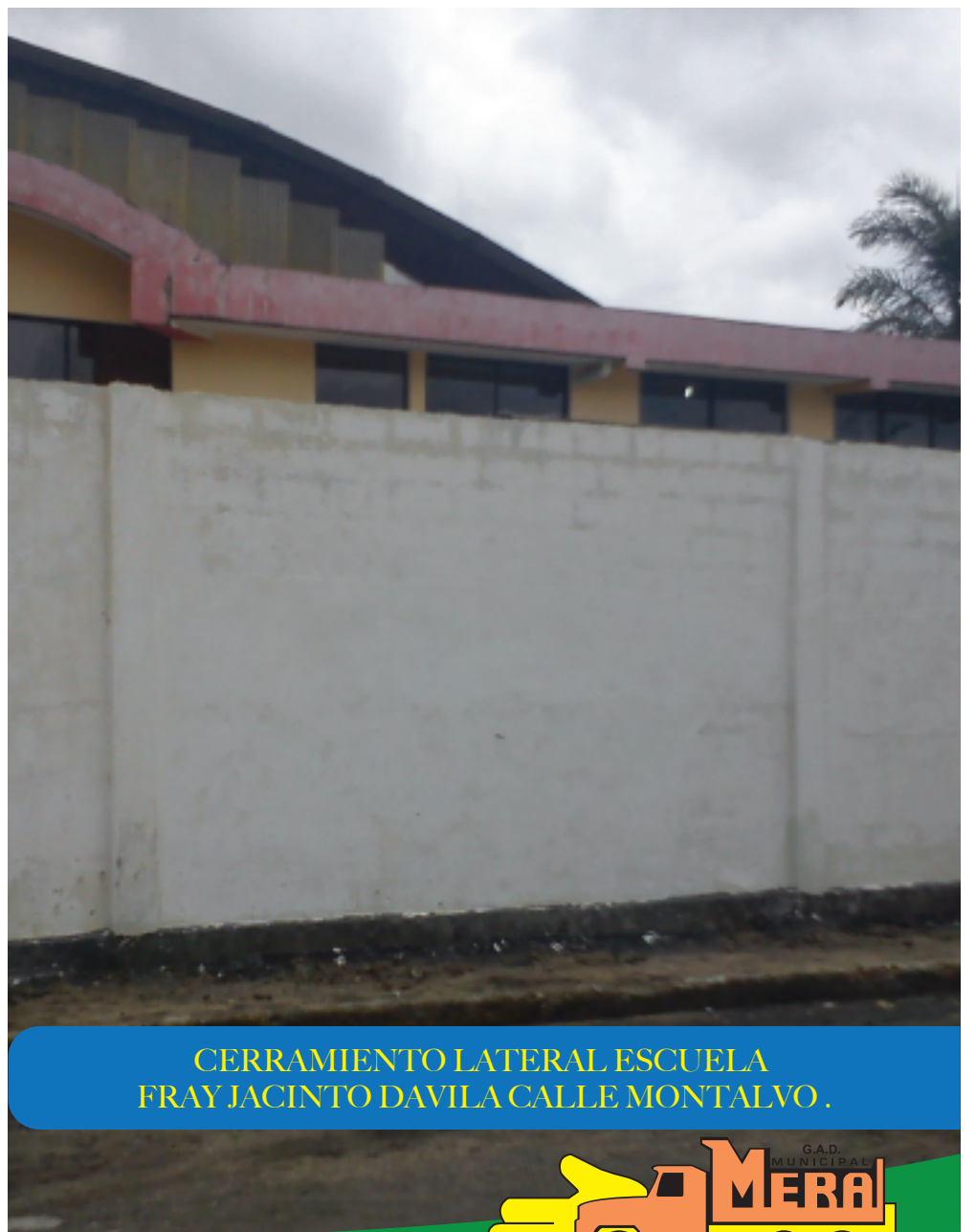
CERRAMIENTO LATERAL ESCUELA FRAY JACINTO DAVILA CALLE MONTALVO.